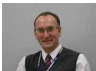
アレキサンダー・ズキウスキー ジョyson・エンド・ジョyson腫瘍薬開発研究所副所長、米国

京都大学医学部卒業後、英国オックスフォード大学など英国で10年間教鞭と研究を行い、現職。