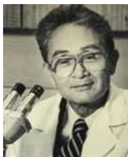
トマス 野口 南カリフォルニア大学法医学名誉教授、米国

野口先生はロスアンジェルス郡検視局長を15年務め、米国では「コロナーの星」と称されています。先生は日本医科大学を卒業後、1951年にロスアンジェルス郡の副コロナーとなり、1967年に検視局長となりました。マリリン・モンロー、ナタリー・ウッド、ロバート・F・ケネディーなど多く著名人の検視官として知られています。野口先生は、米国検視協会会長を1982-83年につとめ、1983年の著書「コロナー(検視官)」は米国でベスト・セラーになりました。1999年に定年されましたが、米国のテレビドラマ「Quincy」でジャック・クルーグマンが演じる人物の实在モデルとされています。